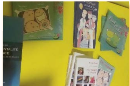
Quelques livres pour bien comprendre l'homoparentalité.