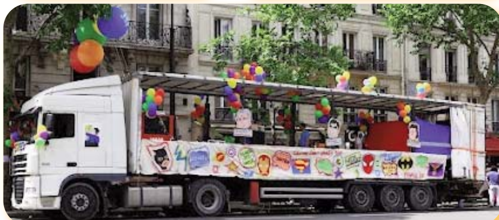
Le char des super héros et héroïnes du Centre LGBT Paris-ÎdF.