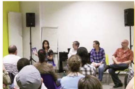
Soirée débat sur l'homoparentalité.