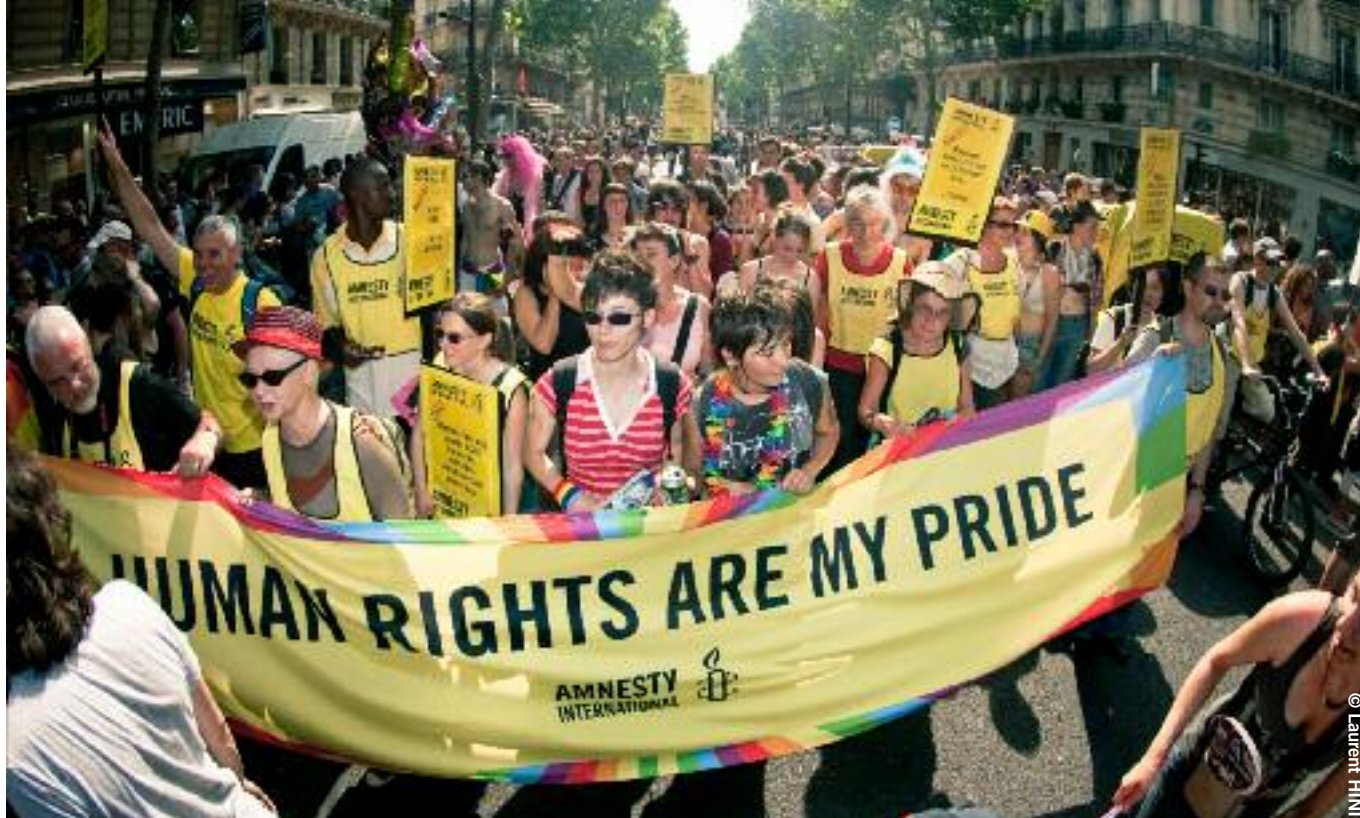
Ci-dessus : Des militants d'Amnesty International participant à la Marche des fiertés de Paris, le 28 juin 2010.