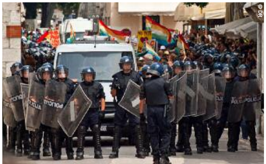
Ci-dessus : Split Pride 2011, rue Marmontova, les participants à la Marche sont escortés par la police. À gauche : Les contremanifestants ont envoyé des gaz lacrymogènes, jeté des pierres et des plantes arrachées de plates-bandes sur les manifestants.

Selon les organisateurs et certains participants, la police n'était pas préparée pour faire face à un tel niveau de violence. Avant même le déroulement de la Marche, des signes précurseurs indiquaient